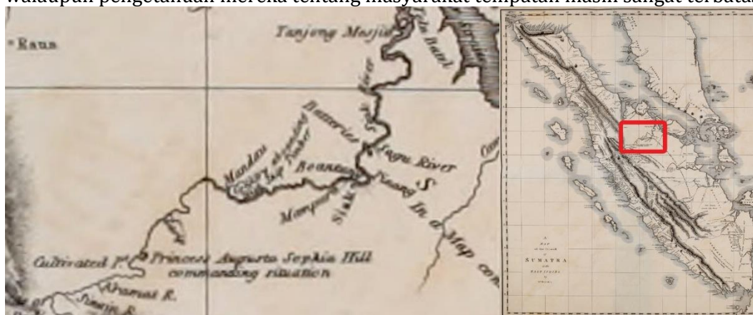
Gambar 1. Lokasi Mandau menurut Peta Marsden.

disebut Mandau atau Mandol. 7 Ia mendapatkan nama lokasi ini berdasarkan peta Belanda. Marsden sama sekali tidak menjelaskan keberadaan komunitas masyarakat yang ada di Mandau tersebut, namun penjelasan ini menunjukkan keberadaan daerah di Sungai Mandau telah diketahui oleh bangsa Eropa walaupun pengetahuan mereka tentang masyarakat tempatan masih sangat terbatas.